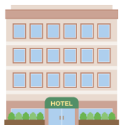
宿泊のみ (個人旅行)