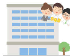
職場旅行 (団体旅行)